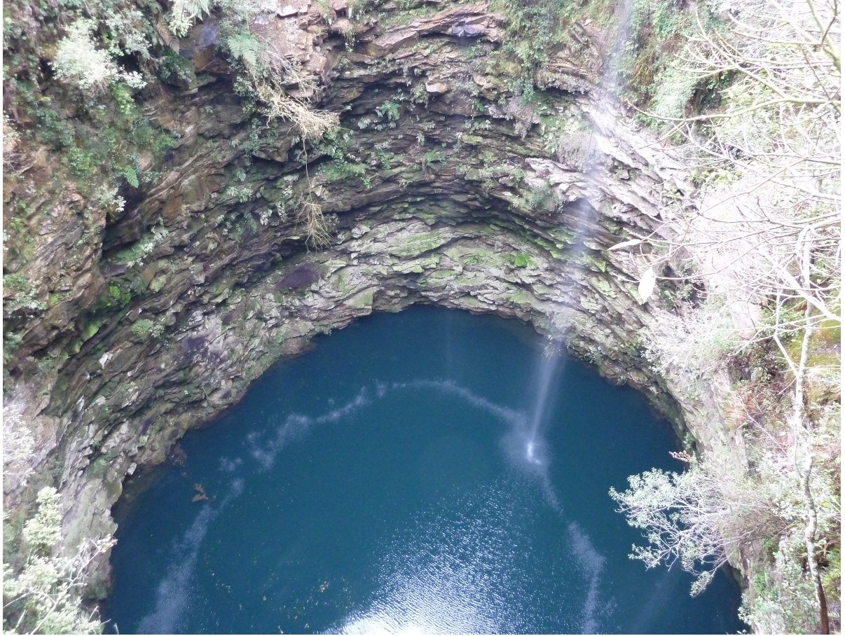
Furnas | Vila Velha